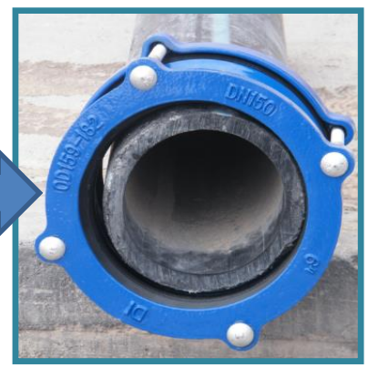
Tubería testigo 1