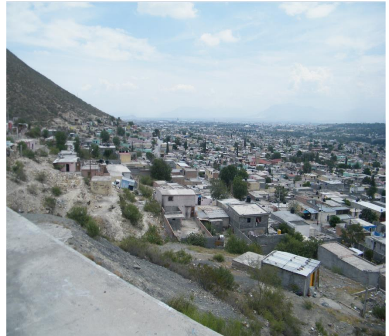
Vista desde el depósito La Minita